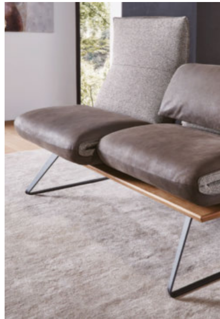
für jeden Sitz separater Sitzvorzug möglich