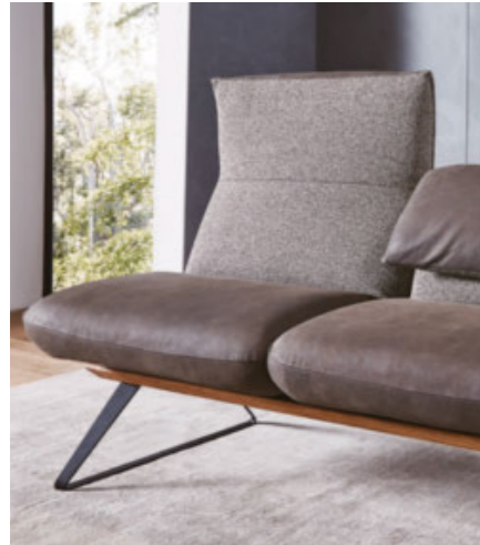
Funktionsrücken mit Verstellbarkeit zum Hochlehner