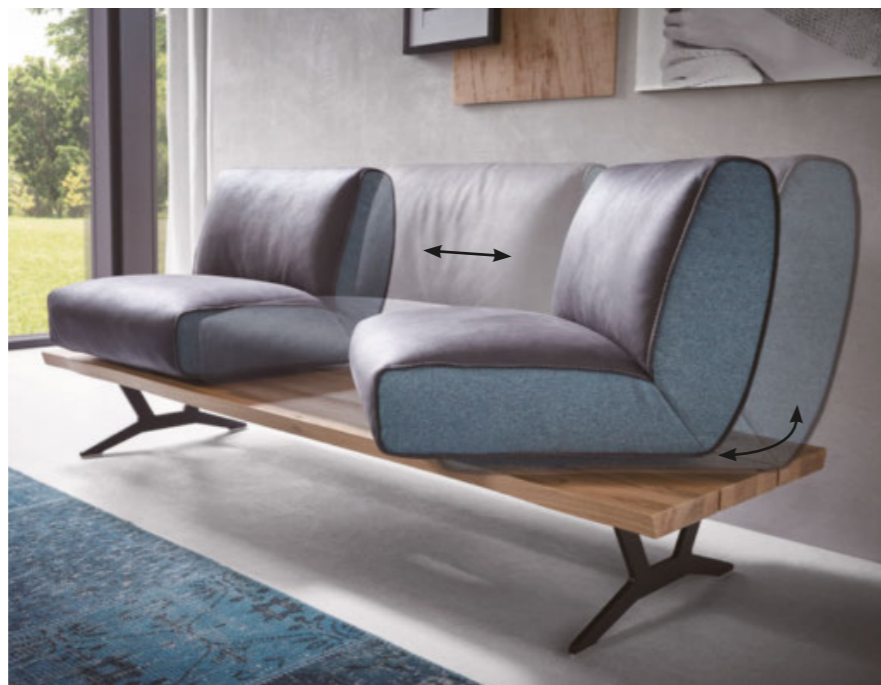
komfortable Schiebe- und Drehfunktion