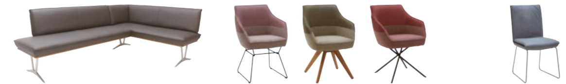
Wales Liverpool Glasgow