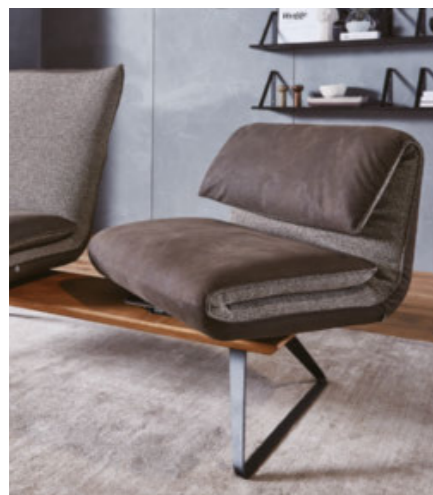
Sitzverstellung nach rechts und links und Drehung per Knopfdruck