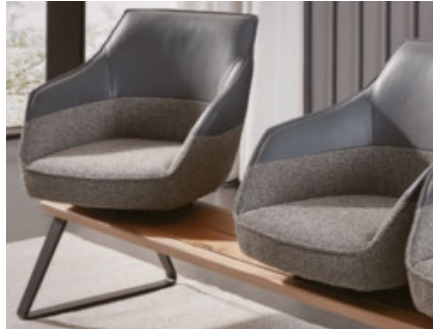
um 360° drehbare Sitzschale mit automatischer Rückstellung

Inspiration Dining begeistert mit extravagantem Design und einzigartigem Komfort. Liverpool bietet luxuriöse Ausstattungsfinessen für noch mehr individuelle Bequemlichkeit. Edle Materialien wie zum Beispiel Bezüge in feinstem Stoff und Leder und Plateaus aus besten Massivhölzern oder in Betonoptik sowie beste handwerkliche Fertigungsverfahren sorgen für ein Qualitätserlebnis der Extraklasse.