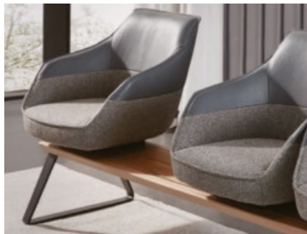
Sitzeinheiten unabhängig voneinander nach rechts und links schiebbar