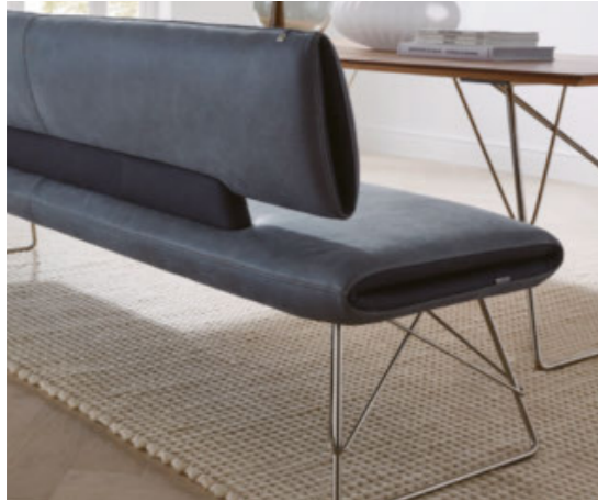
Bezugskombination als besonderes Gestaltungselement

Mit klarer Formensprache spiegelt Glasgow Ihren einzigartigen Lebensstil wider. Kreieren Sie ein hochwertiges wie außergewöhnliches Ambiente. Erleben Sie optische Highlights wie die filigranen Kufen in Edelstahloptik und freuen Sie sich auf gekonnte Details wie die zweifache Bezugskombination oder die Verarbeitung mit Kontrastfäden.