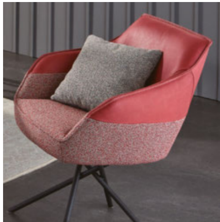
zweifache Bezugskombinationen individuell möglich