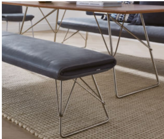
Hockerbank für ein großzügiges Sitzplatzensemble