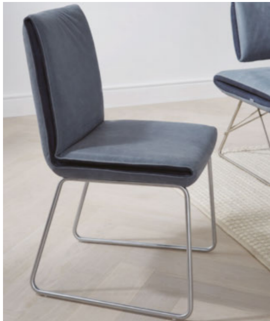
Designstuhl mit Kufen in Edelstahloptik