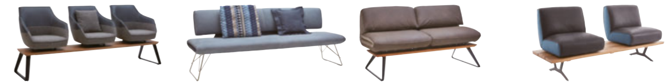
Liverpool Glasgow Windsor Montreal