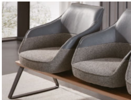
hochwertiger Sitzvorzug für optimale Bequemlichkeit