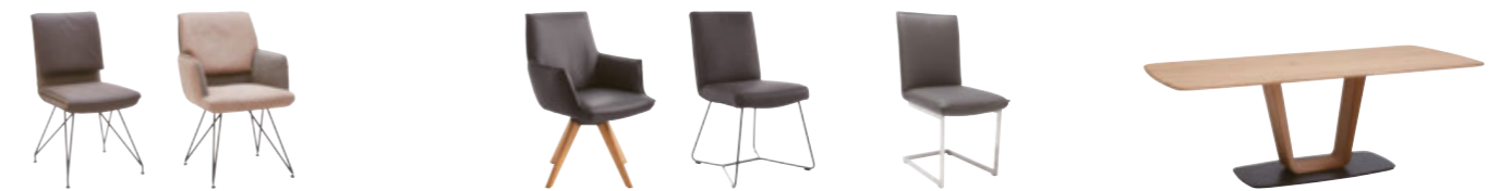
Windsor Montreal Wales Liverpool