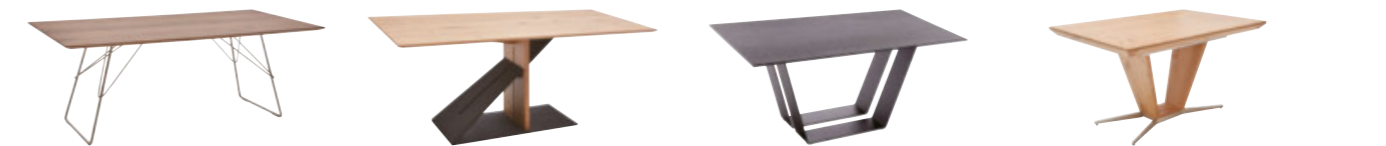
Glasgow Windsor Montreal Wales