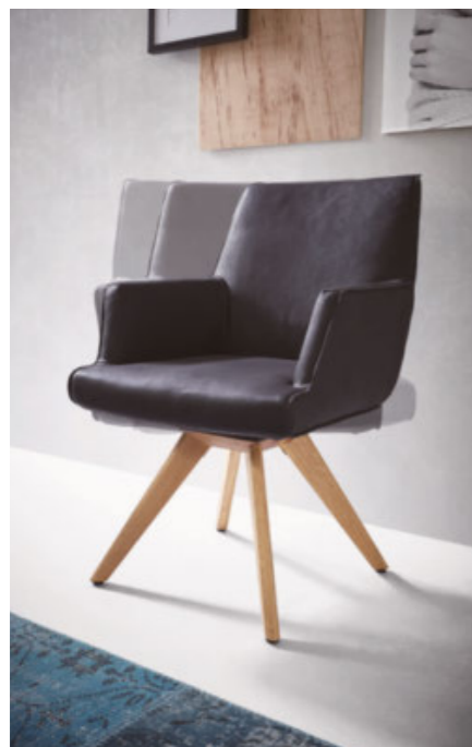
drehbarer Armlehnsessel Linie Montreal